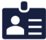
Halterhaftung § 7 StVG